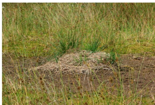
Kraanvogelnest op 8 juli 2015.

Op 8 juli is de nestlocatie bezocht en werd vastgesteld dat hetzelfde nest is gebruikt als in 2014. Op het nest zijn enkele kleine eischalresten gevonden (verbleekt) en op 1,5 m van het nest enkele stukken verdroogd eivlies. Een cirkel van 4 – 5m rond het nest was vegetatieloos en bestond uit een brei van dood veenmos met een diepte van 30 - 60 cm. Het “waterpeil” was duidelijk lager dan bij het nestbezoek op 31 mei 2014 (zie foto’s).