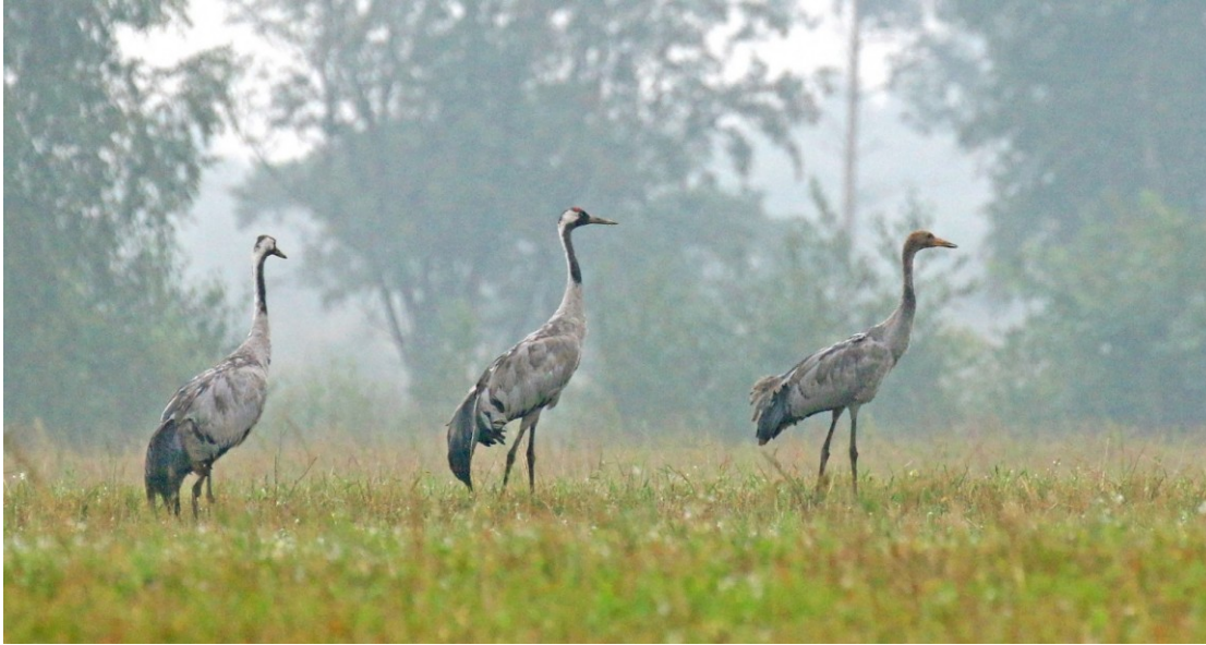
Paar Kraanvogels met vliegvlug juveniel op 24 augustus 2015.