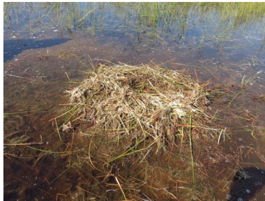
Kraanvogelnest op 31 mei 2014.