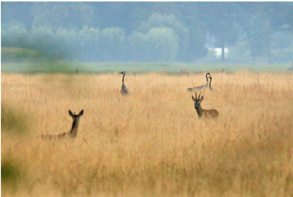
Broedpaar met juveniele vogel op 10 augustus 2015.

In 2014 is voor het eerst met zekerheid een broedgeval van een paar Kraanvogels in Overijssel vastgesteld (van den Akker & Schepers 2014). Helaas was dit broedgeval in de Engbertsdijksvenen zonder succes. In 2015 echter is in hetzelfde gebied een succesvol broedgeval vastgesteld waarbij 1 juveniel vliegvlug werd. In dit artikel doen we verslag van de waarnemingen. Kraanvogels zijn gevoelig voor verstoring door menselijke activiteiten. Om risico op verstoring te voorkomen ontbreken daarom kaartmateriaal en gebiedsnamen in dit artikel. De onderzoeksmethode in 2015 was vrijwel identiek aan 2014 (van den Akker & Schepers 2014), alleen zijn in 2015 geen simultaantellingen uitgevoerd.